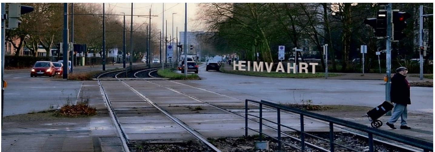
Der Schriftzug HEIMVAHRT begrüßt die Bewohner*innen des Stadtteils „Neue Vahr“