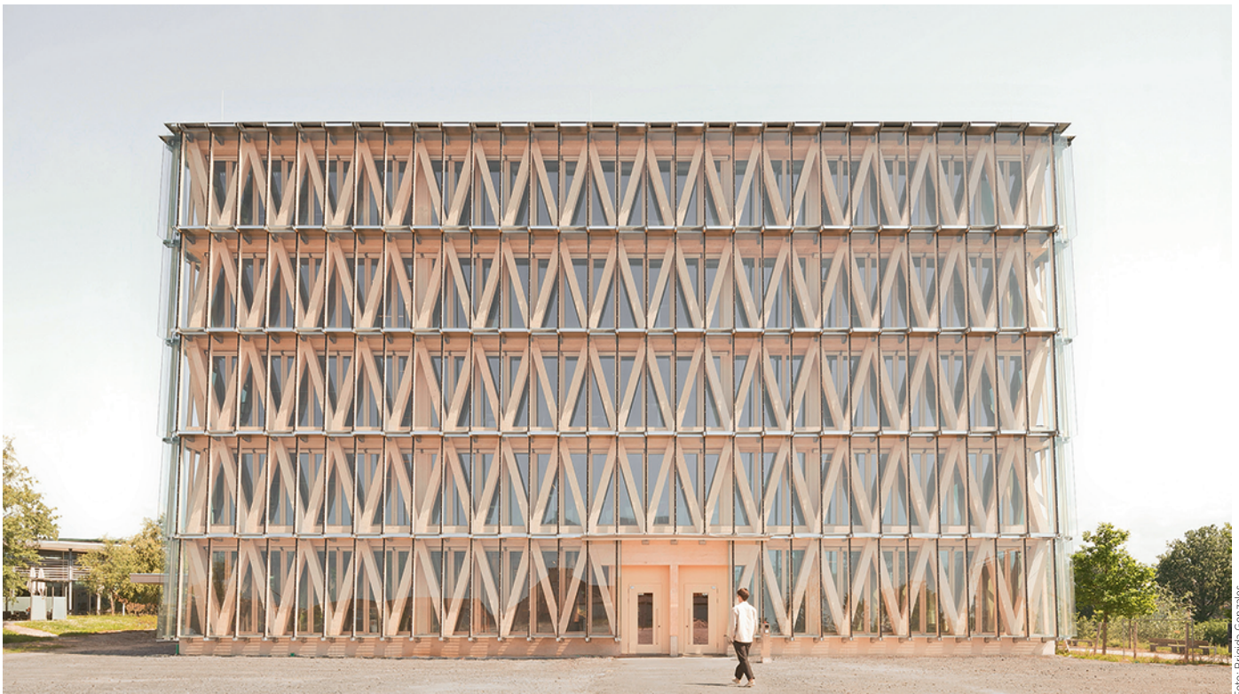
Innovationsfabrik Heilbronn, Entwurf: Waechter + Waechter Architekten

Für beide Veranstaltungen ist der Eintritt frei.